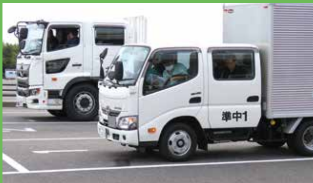
法規走行と添乗指導

https://ssl.aitokyo.jp/chubu_center/nintei-kouza/