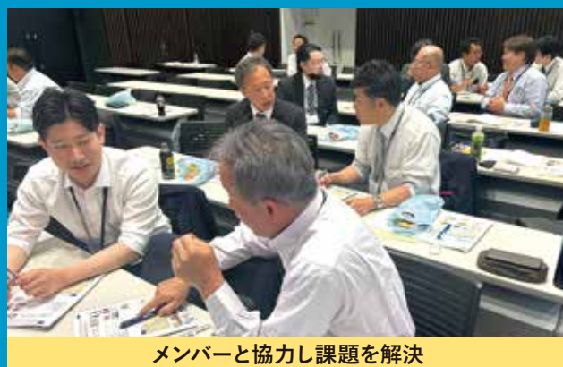
メンバーと協力し課題を解決