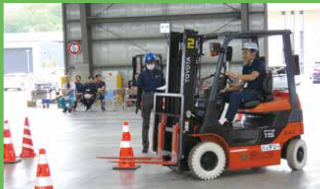
フォークリフトの安全対策