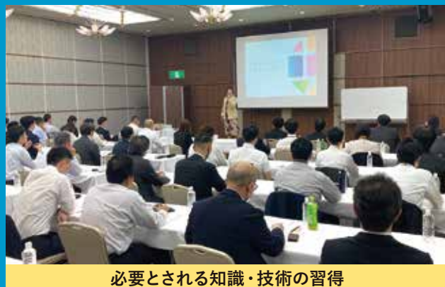
必要とされる知識・技術の習得