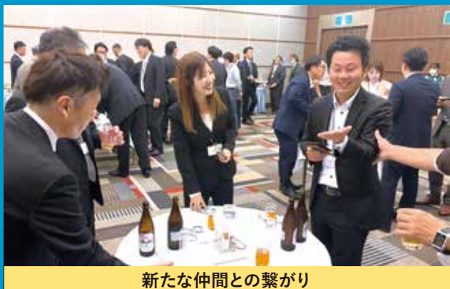
新たな仲間との繋がり