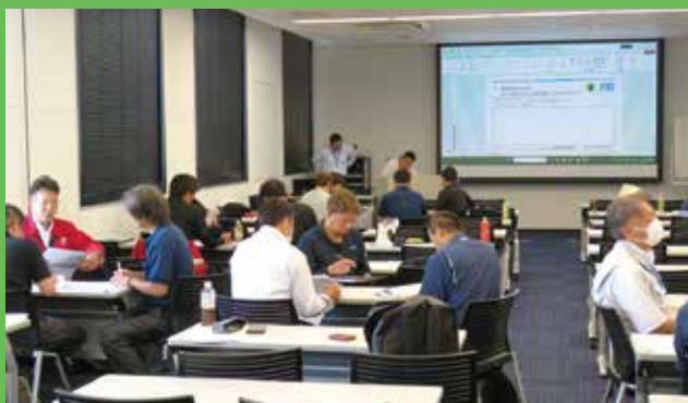
ドライバー教育人材育成