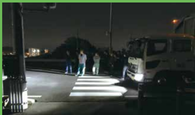
夜間運転時の特性