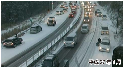
名阪国道 南在家IC付近