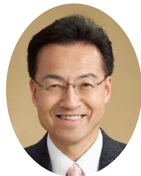
知事 杉本 達治