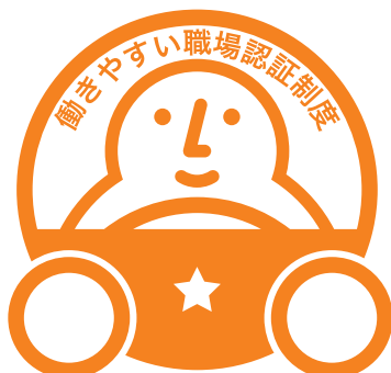
「一つ星」認証マーク