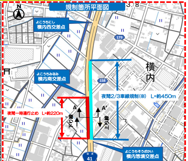
(国土地理院標準地図に地名、範囲を加工掲載)