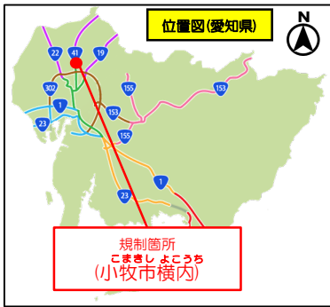
通行規制カレンダー(予定)