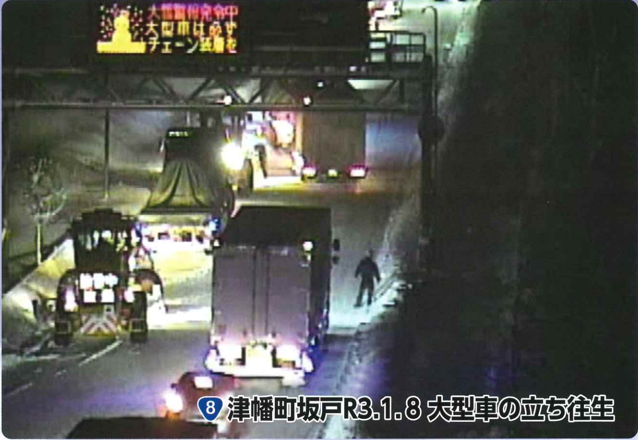
8 津幡町坂戸R3.1.8 大型車の立ち往生