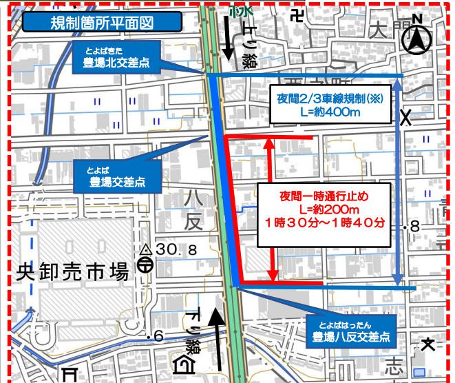
2/3車線規制箇所(※) 一時通行止め箇所