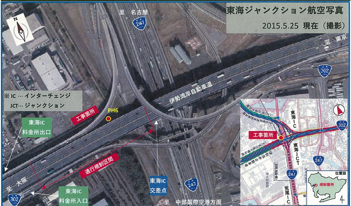
東海ジャンクション航空写真