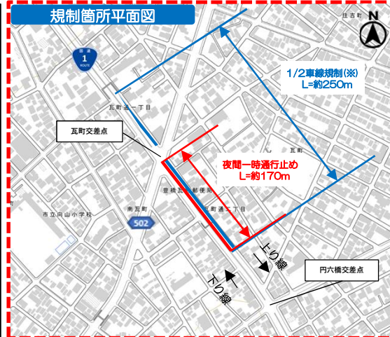
(国土地理院標準地図に地名、範囲を加工掲載)