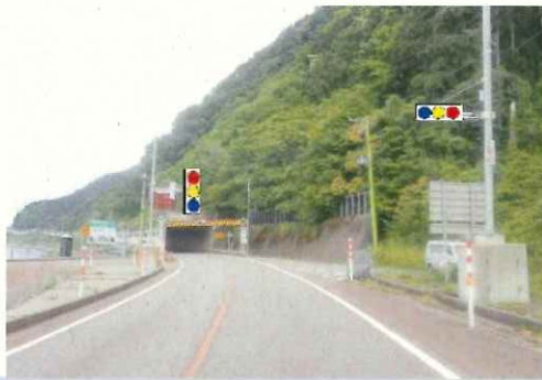
信号規制箇所イメージ