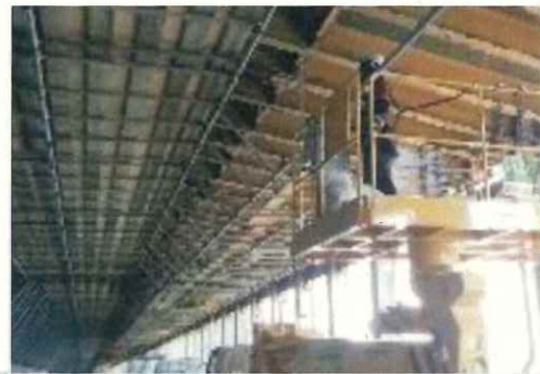
洞門内の梁部材補修状況