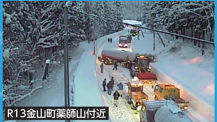
R13金山町薬師山付近