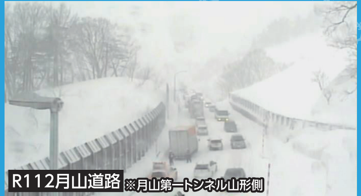
R112月山道路 ※月山第一トンネル山形側