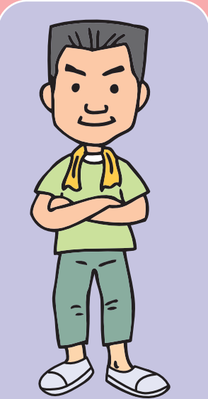
えど がわさぶろう 江戸川三郎 東京下町生まれのトラック運転手。細かいことが苦手で、気が大きくなって人情に厚い男気あふれる性格。最近、仕事で山形に荷物を運ぶようになった。演歌が好き。