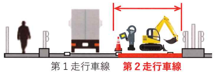
【昼夜連続車線規制】