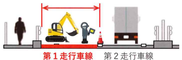
【昼夜連続車線規制】