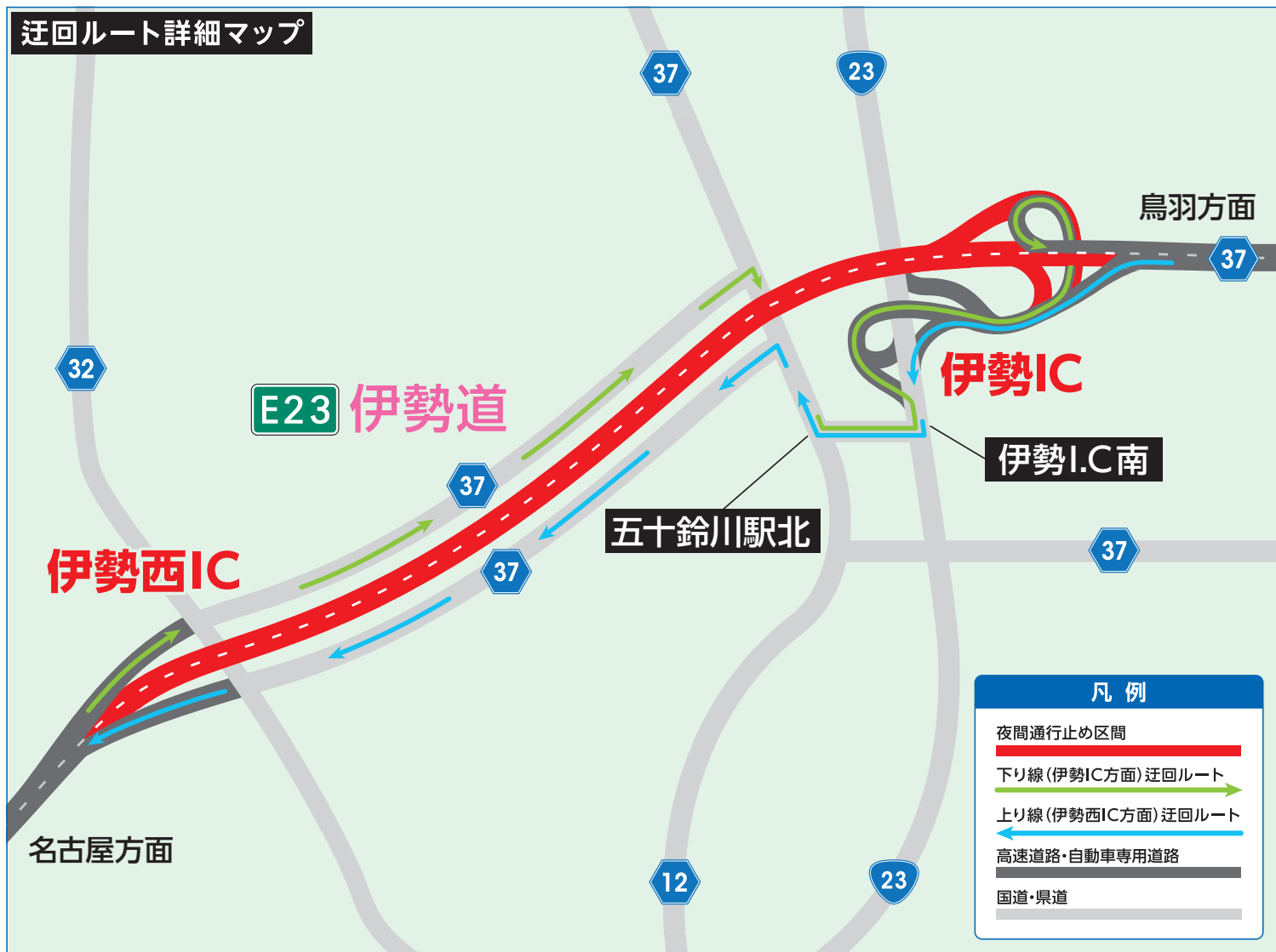
迂回ルート詳細マップ